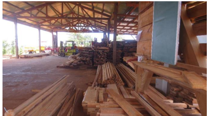
Visite de la scierie « Tubuai Bois »

* rencontrer les gendarmes de l'île afin de faire un point sur l'activité de 2017, en particulier s'agissant des actions de prévention développées en partenariat avec les établissements scolaires.