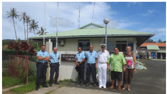
Visite de la brigade de gendarmerie de Tubuai

Au terme de son déplacement, le Tavana hau des îles Australes a tenu à remercier le Maire de la commune de Tubuai, son conseil municipal ainsi que les cadres de la commune pour l'accueil qui lui a été réservé et a réaffirmé la volonté de l'Etat d'accompagner les communes des Australes dans leurs projets de développement.