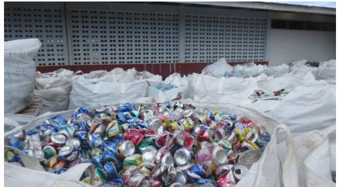
Stockage des déchets recyclables au parc à matériels en attente de valorisation : canettes en aluminium, bouteilles en plastique...

* rencontrer M. Jérôme BOST, Principal du collège de Mataura et visiter le site où des travaux de rénovation des internats (filles et garçons) sont financés par le Pays. Ces travaux devraient démarrer début janvier 2019.