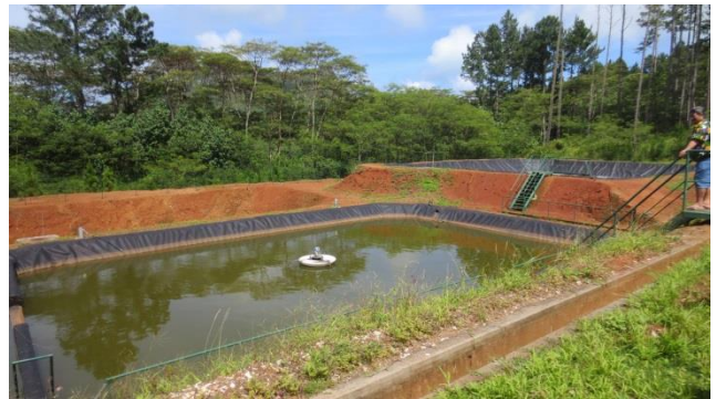
Bassin d'aération (unité de traitement des lixiviats)