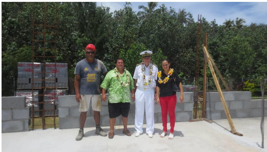
Visite du chantier de reconstruction de l'école maternelle Teina, à Mataura