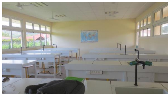
Salle de classe des sciences de la vie et de la terre