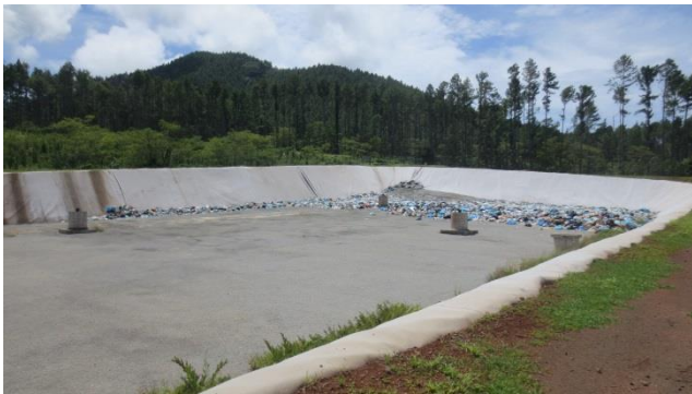
Casier de catégorie 2 pour les déchets ménagers