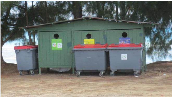
Tri des recyclables en point d'apport volontaire (PAV) et collecte des ordures ménagères en bac de regroupement