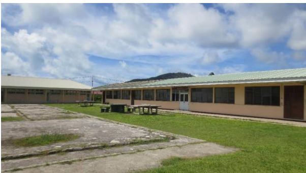
Cour du collège de Mataura